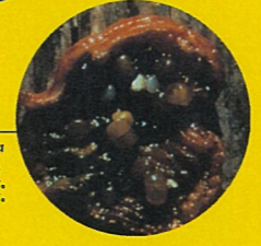
海鳥の砂糞(そのう)の中 写真は、着にプラスチックの漁網が引っかかってしまい、取れずに苦しむキタオットセイの姿です。