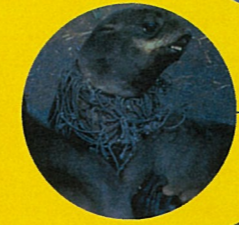
キタオットセイ 写真は、着にプラスチックの漁網が引っかかってしまい、取れずに苦しむキタオットセイの姿です。