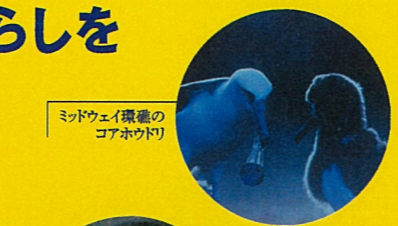
ミッドウェイ環礁のコアホウドリ

日本海沿岸の海岸には、中国や韓国などの外国由来のものを含む大量のゴミが漂着しています。一方、日本から流出したゴミもまた遠く離れた北太平洋赤道近くまで達するともいいます。写真は、ミッドウェイ環礁に生息するコアホウドリのヒナ3羽の死骸から出てきたプラスチックゴミです。容器のフタ、歯ブラシや釣り用の浮き、使い捨てライターなど様々です。北太平洋の海洋環境の保全には、国際的な協力はもちろんのこと、それぞれ国内での発生源対策が急務となっています。