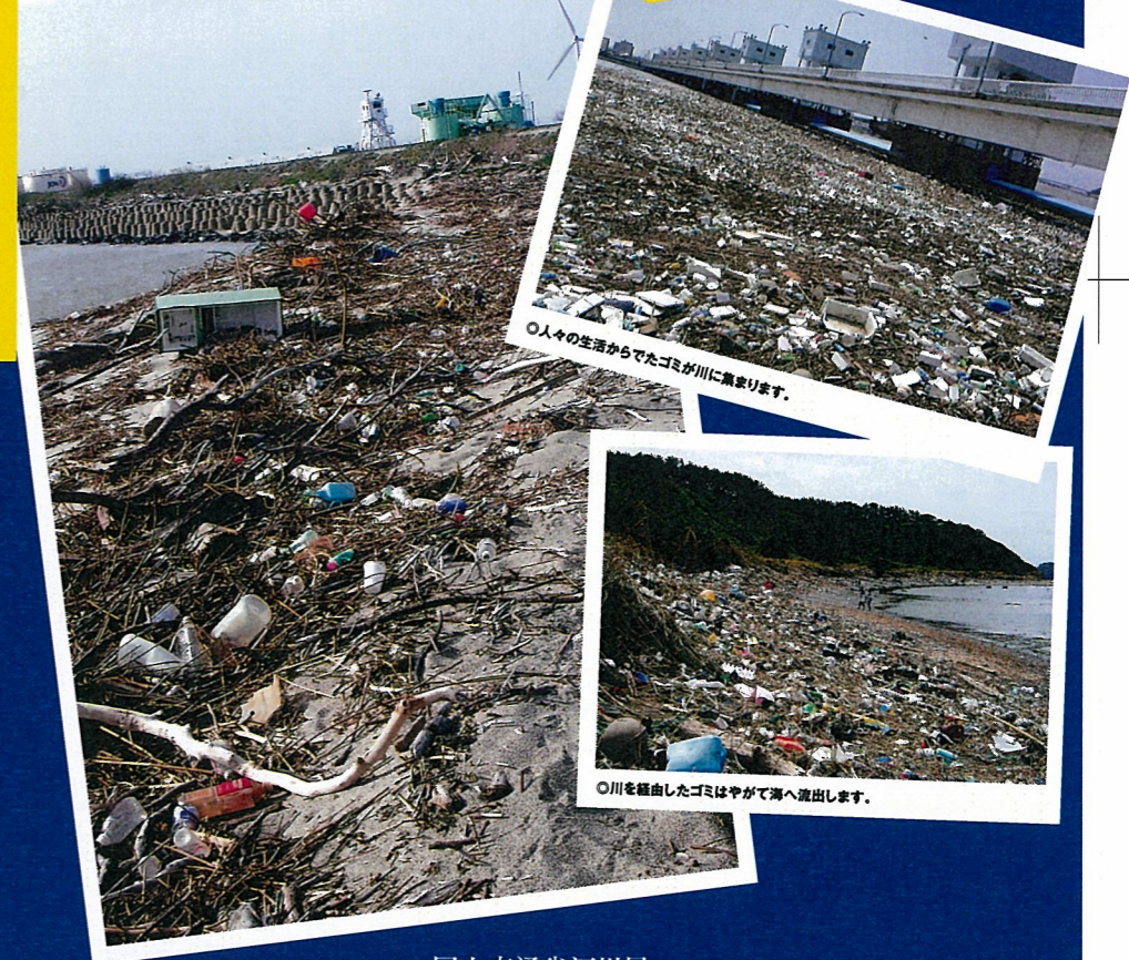
○人々の生活からでたゴミが川に集まります。